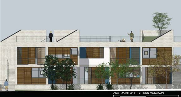
ΑΝΑΤΟΛΙΚΗ ΟΨΗ ΤΥΠΙΚΩΝ ΜΟΝΑΔΩΝ