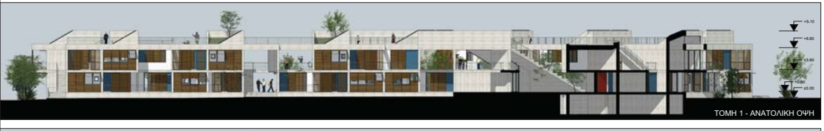
ΤΟΜΗ 1 - ΑΝΑΤΟΛΙΚΗ ΟΨΗ