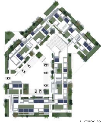
21 ΙΟΥΝΙΟΥ 12:00