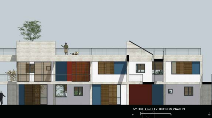
ΔΥΤΙΚΗ ΟΨΗ ΤΥΠΙΚΩΝ ΜΟΝΑΔΩΝ