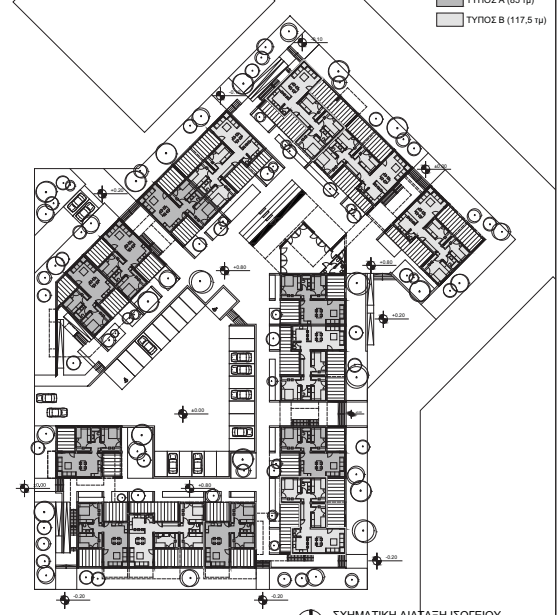
ΣΧΗΜΑΤΙΚΗ ΔΙΑΤΑΞΗ ΙΣΟΓΕΙΟΥ