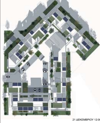
21 ΔΕΚΕΜΒΡΙΟΥ 12:00