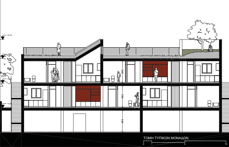
ΤΟΜΗ ΤΥΠΙΚΩΝ ΜΟΝΑΔΩΝ