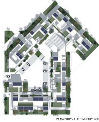
21 ΜΑΡΤΙΟΥ / ΣΕΠΤΕΜΒΡΙΟΥ 12:00